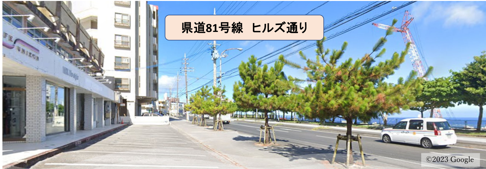
県道81号線 ヒルズ通り