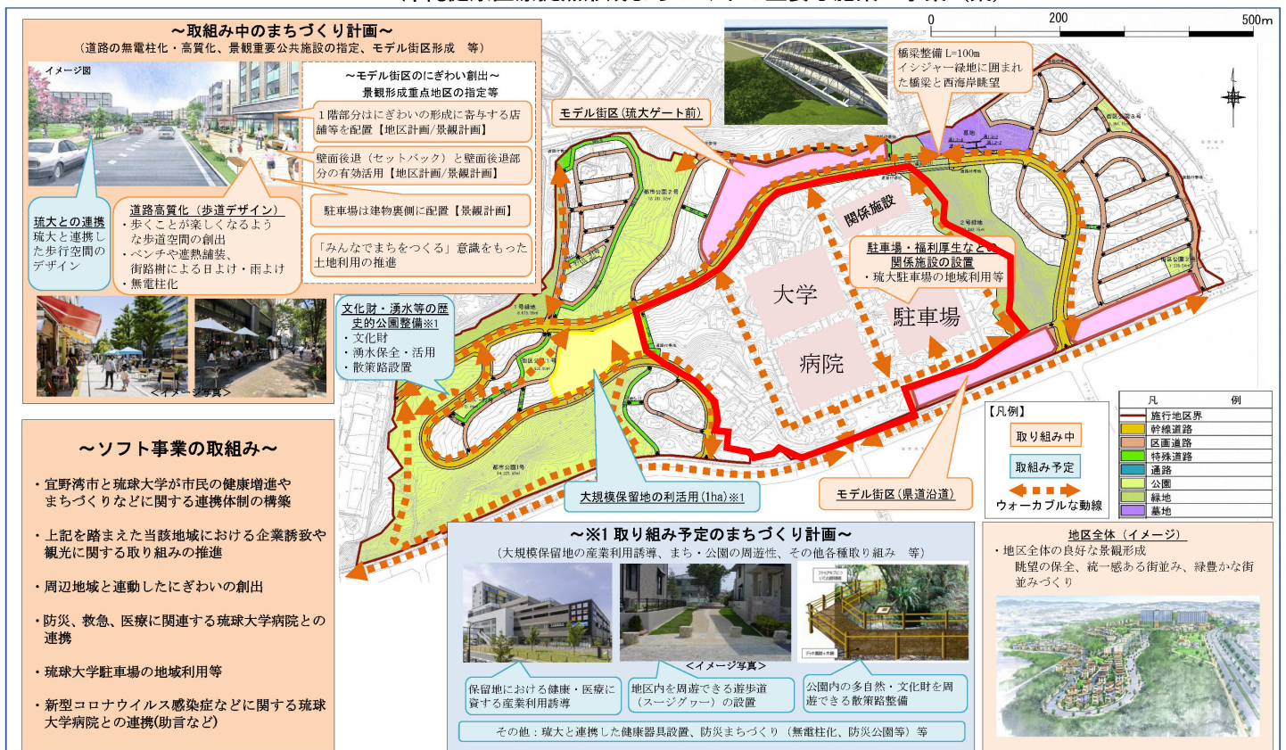
『跡地利用の先行モデル地区となる西普天間住宅地区跡地の沖縄健康医療拠点形成』に向けて 沖縄健康医療拠点形成まちづくりの主要な施策・事業（案）