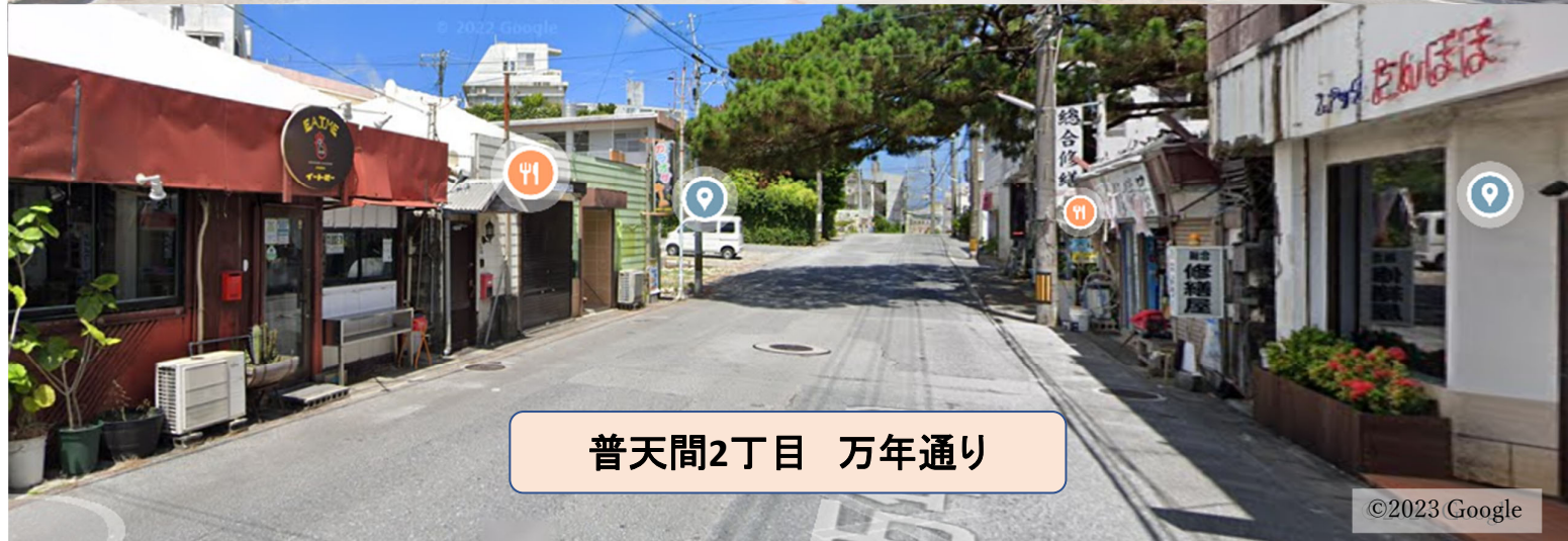
普天間2丁目 万年通り